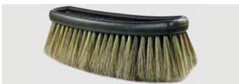
Einsatz. A= 260. B= 230 x 80 mm. Schweineborsten