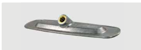
Träger. B= 230 mm. Aluminium