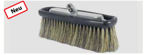
A= 260. B= 230 x 80 mm. Schweineborsten. Mit Trägerplatte Edelstahl. Max. 50 °C