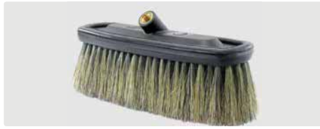
A= 260. B= 230 x 80 mm. Schweineborsten. Max. 50 °C