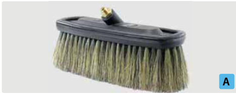
A= 260. B= 230 x 80 mm. Schweineborsten. Max. 50 °C