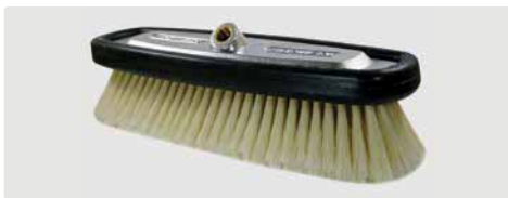
A= 300. B= 300 x 100 mm. Nylon