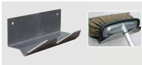
Geeignet für alle Bürsten. Lochabstand 202 mm. H x B x T = 90 x 250 x 100 mm