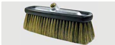
A= 240. B= 230 x 80 mm. Schweineborsten