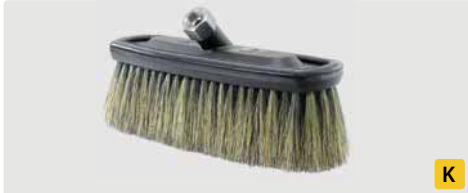
A= 260. B= 230 x 80 mm. Schweineborsten. Max. 50 °C