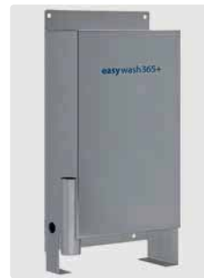
Bürstenbehälter mit Überlauf und seitlichem Abflusstopfen zur Reinigung. Wand- und Bodenmontage. H x B x T = 670 x 340 x 143 mm