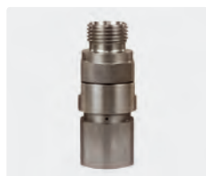
1/2" M : 1/2" F. Max. 600 bar