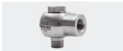
1/2" M : 1/2" F. Inox. Max. 600 bar