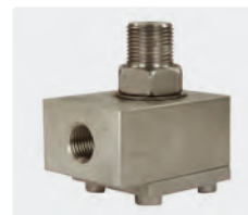
1/4" F : 3/8" M. Corps et moyeu en inox. Max. 600 bar / 90 °C