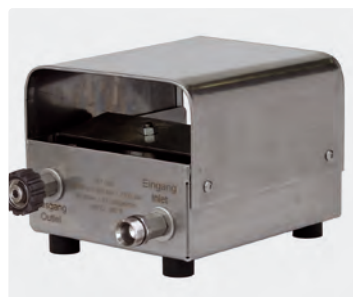
Coffret inox. Clapet inox. Pieds caoutchouc. Max. 500 bar / 80 l/min / 150 °C