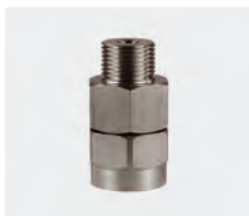
3/8" M : 3/8" F. Max. 600 bar