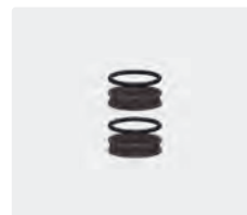
Kit joints pour raccord 750 280 0