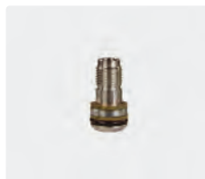
Kit de réparation ST-350