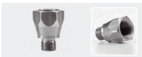
Inox. 500 bar