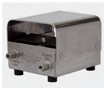
Coffret inox. Clapet inox. Pieds caoutchouc. Max. 500 bar / 80 l/min / 150 °C