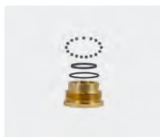
Kit de réparation ST-351