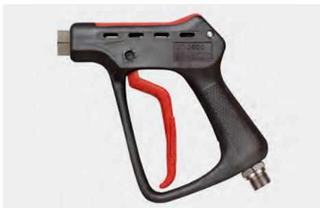
Pistolet THP professionnel. Max. 500 bar / 80 l/min / 150 °C