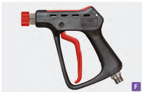
Pistolet THP professionnel avec sortie M22 F. Max. 500 bar / 80 l/min / 150 °C