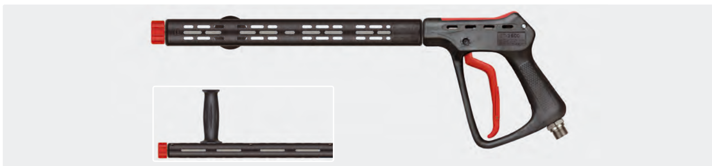
Pistolet THP professionnel avec demi-coquilles ST-9 380 mm, poignée latérale et raccord manuel M22 F. Max. 500 bar / 80 l/min / 150 °C