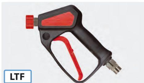
Pistolet THP professionnel avec système breveté LTF. Max. 500 bar / 30 l/min / 150 °C