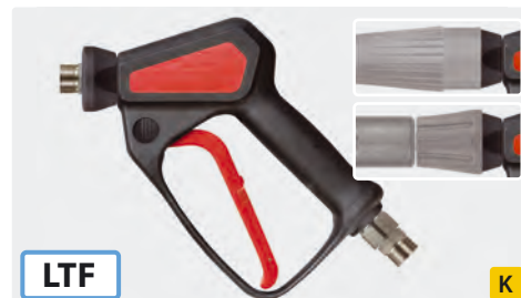
Pistolet THP professionnel avec système breveté LTF. Pistolet avec raccord de sortie surmoulé adaptable sur lances rotatives. Max. 500 bar / 30 l/min / 150 °C