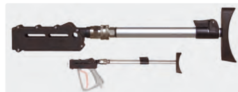
Crosse de pistolet ST-3900 extensible. La nouvelle directive UE prescrit l'usage obligatoire d'une crosse de maintien à partir d'une force de recul supérieure à 150 N. Crosse réglable équipée d'un coupleur rapide rotatif. Adaptable sur tous les pistolets THP ST-3600 / ST-3500.