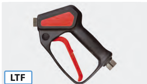
Pistolet THP professionnel avec système breveté LTF. Max. 500 bar / 30 l/min / 150 °C