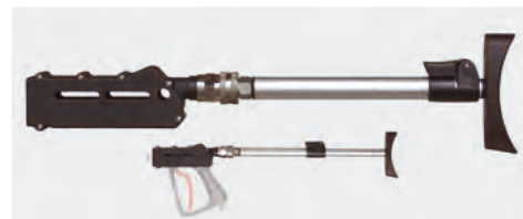
Crosse de pistolet ST-3900 extensible. La nouvelle directive UE prescrit l'usage obligatoire d'une crosse de maintien à partir d'une force de recul supérieure à 150 N. Crosse réglable équipée d'un coupleur rapide rotatif. Adaptable sur tous les pistolets THP ST-3600 / ST-3500.