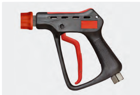
Pistolet THP professionnel avec coupleur ST-45. Max. 600 bar / 80 l/min / 150 °C