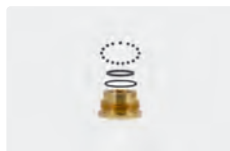
Kit réparation pour raccord ST-351