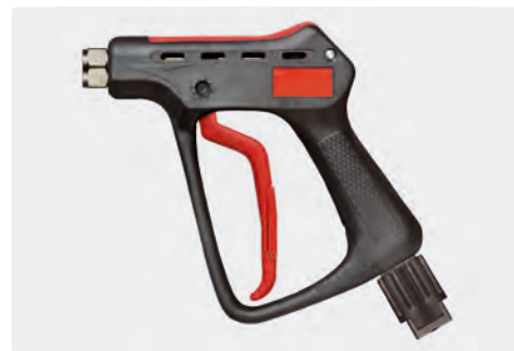
Pistolet THP professionnel. Max. 600 bar / 80 l/min / 150 °C