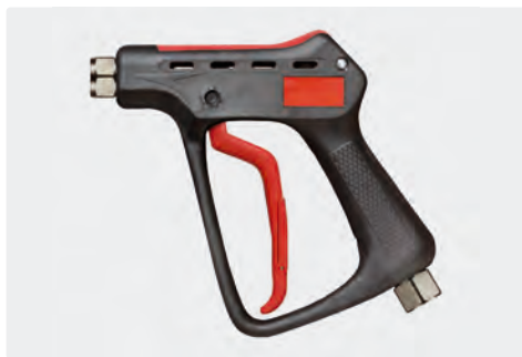
Pistolet THP professionnel. Max. 600 bar / 80 l/min / 150 °C