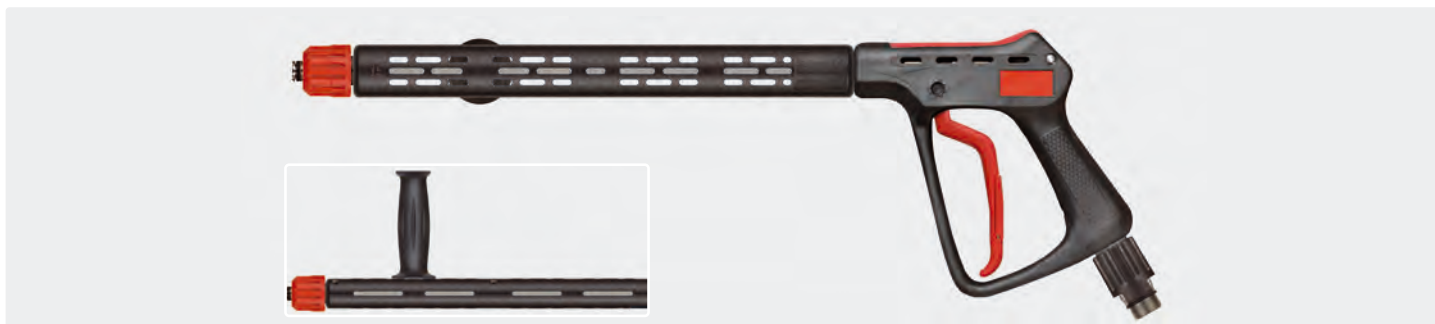
Pistolet THP professionnel avec demi-coquilles ST-9 380 mm, poignée latérale et raccord manuel ST-740. Max. 600 bar / 80 l/min / 150 °C