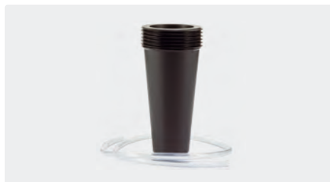
Pour bidons de 5 à 30 litres. PVC. Incl. 0,5 m de tuyau d'aspiration produit translucide, DN 4