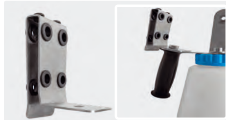
Avec tampons de protection en élastomère. Acier inoxydable