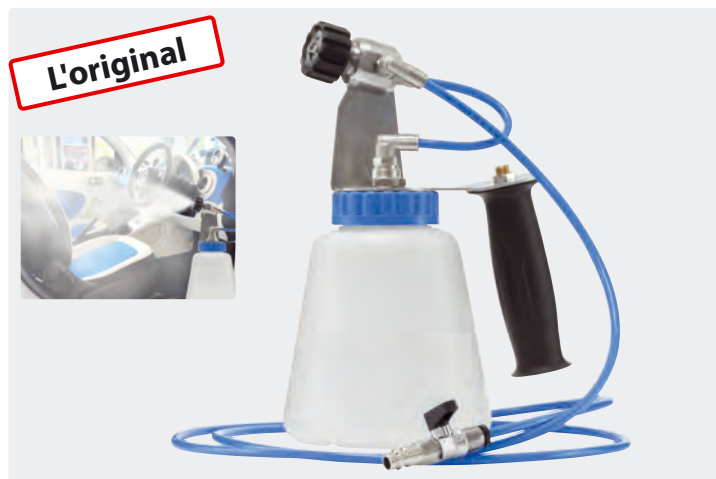
Brumisateurs à froid ST-83.1. Pour le raccordement à air comprimé de 3 bar, 180-220 l/min. Acier inoxydable/PVC