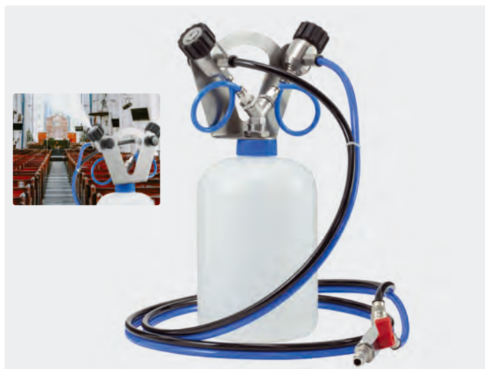
Brumisateurs à froid ST-83.2. Pour le raccordement à air comprimé de 3 bar, 200-400 l/min. Acier inoxydable/PVC