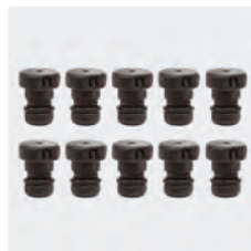
Jeu de 10 gicleurs (de 0,5 à 2,0 mm). Gicleurs livrés avec joint torique