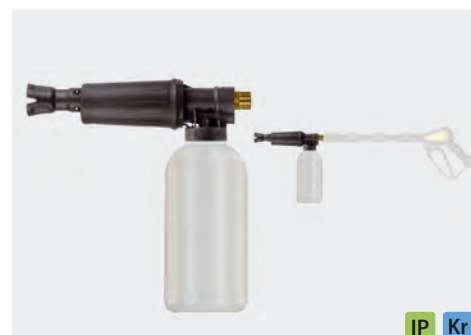
M22 M. Canons à mousse avec doseur et bidon. Max. 300 bar / 80 °C