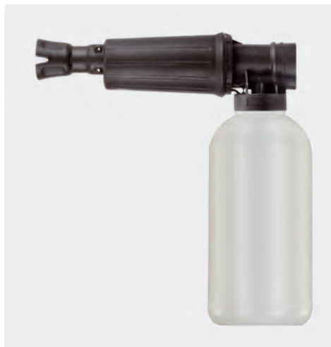
1/4" F. Canons à mousse avec doseur et bidon. Max. 300 bar / 80 °C