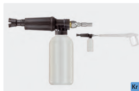
Coupleur KR. Canons à mousse avec doseur et bidon. Max. 300 bar / 80 °C