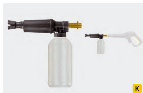
Baïonnette K. Laiton. Canons à mousse avec doseur et bidon. Max. 300 bar / 80 °C