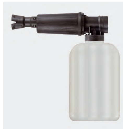
1/4" F. Canons à mousse avec doseur et bidon. Max. 300 bar / 80 °C