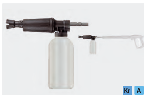
Coupleur KW. Canons à mousse avec doseur et bidon. Max. 300 bar / 80 °C