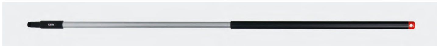
Manche ergonomique équipé poignée isolante