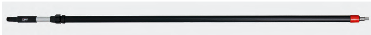
Manche télescopique avec poignée isolante. Raccord cannelé pour tuyaux 1/2" et 3/4"