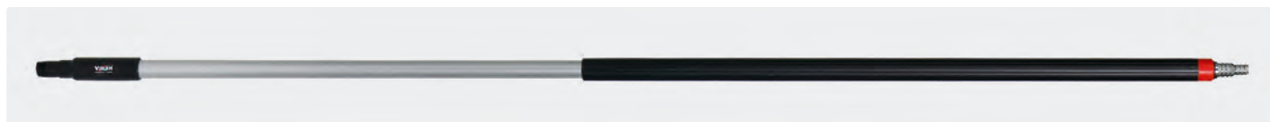
Manche ergonomique équipé poignée isolante. Raccord cannelé pour tuyaux 1/2" et 3/4"