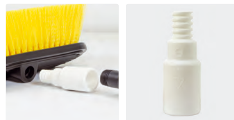
Adaptateur pour manches Vikan. Filetage cordelé mâle : filetage femelle conique