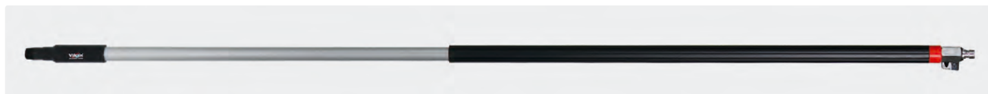
Manche ergonomique équipé poignée isolante et d'une vanne d'arrêt. Coupleur adaptable système Nito