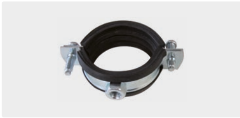
Edelstahl V2A. 1.4301 / AISI 304