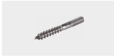
Stockschraube. Edelstahl. M8 x 80