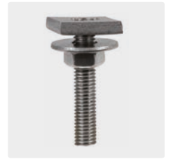
M8 x 30. Edelstahl