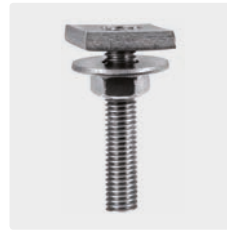
M8 x 30. Stahl verzinkt