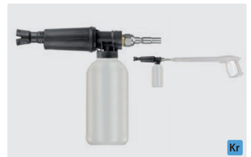
Stecknippel KR. Schauminjektorlanze mit Dosierung und Flasche. Max. 300 bar / 80 °C