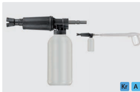
Stecknippel KW. Schauminjektorlanze mit Dosierung und Flasche. Max. 300 bar / 80 °C