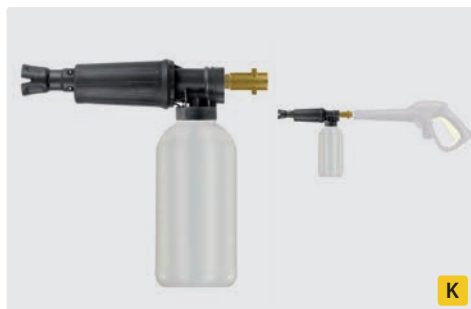
Bajonett K. Messing. Schauminjektorlanze mit Dosierung und Flasche. Max. 300 bar / 80 °C