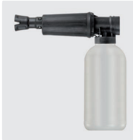
1/4" IG. Schauminjektorlanze mit Dosierung und Flasche. Max. 300 bar / 80 °C