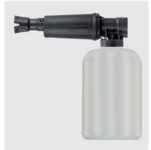
1/4" IG. Schauminjektorlanze mit Dosierung und Flasche. Max. 300 bar / 80 °C