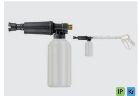
M22 AG. Schauminjektorlanze mit Dosierung und Flasche. Max. 300 bar / 80 °C