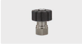
HV M22 : IG. Edelstahl