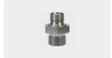
AG : AG. Stahl verzinkt