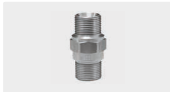
M22 AG : AG. Edelstahl