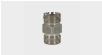
DKOS M22 AG : AG. Edelstahl