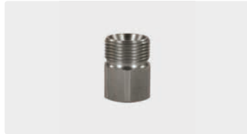
M22 AG : IG. Edelstahl