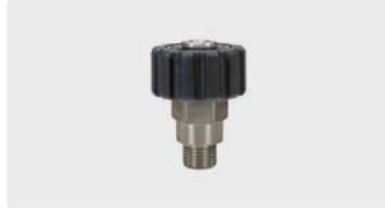
HV M22 : AG. Edelstahl