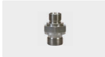
AG : AG. Edelstahl