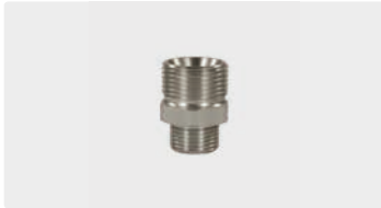
M22 AG : AG. Edelstahl