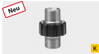
M22 AG. Schwere Ausführung mit Gummischutzkappe. Edelstahl. Max. 500 bar