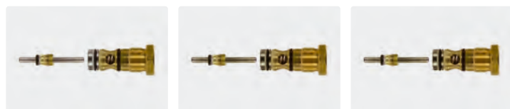
Standard Clapet H/G pleureur Clapet H/G à clapet