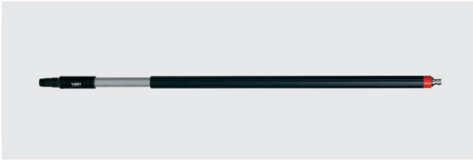
Alustiel. Ergonomischer Stiel mit isoliertem Griff. Stecknippel passend für Nito System