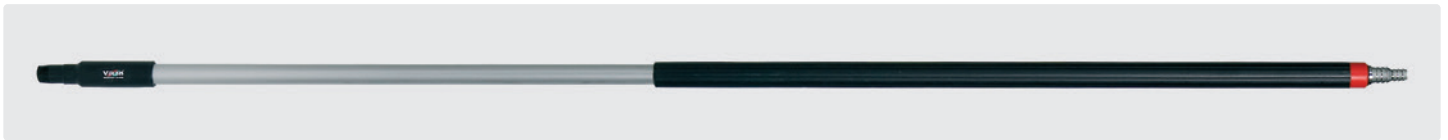
Alustiel. Ergonomischer Stiel mit isoliertem Griff. Schlauchtülle passend für 1/2" und 3/4" Schlauch