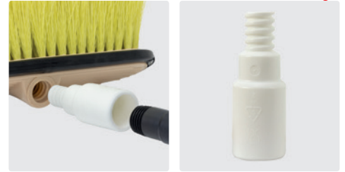
Adapter für Lanzen ohne Kordelgewinde. Kordelgewinde AG : Gewinde IG