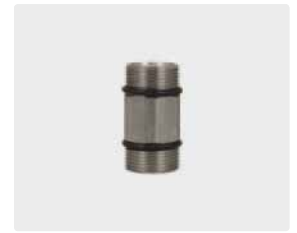
M24 M : M24 M. Max. 700 bar / 150 °C