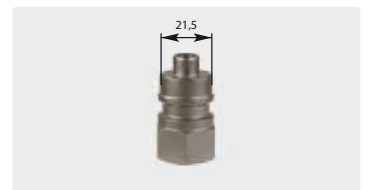
Plug : F. Stainless steel. Max. 600 bar / 150 °C