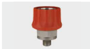
Coupling : M. Stainless steel. Max. 600 bar / 150 °C