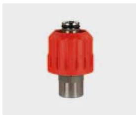
M24 F : F. Max. 700 bar / 150 °C