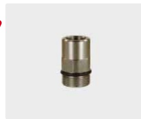
F : M24 M. Max. 700 bar / 150 °C