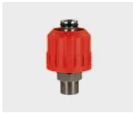
M24 F : M. Max. 700 bar / 150 °C