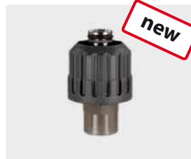
M24 F : F. Max. 700 bar / 150 °C