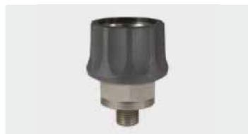
Coupling : M. Stainless steel. Max. 600 bar / 150 °C