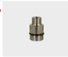
M : M24 M. Max. 700 bar / 150 °C