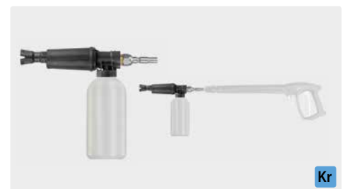
Stecknippel KR. Schauminjektorlanze mit Dosierung und Flasche. Max. 300 bar / 80 °C