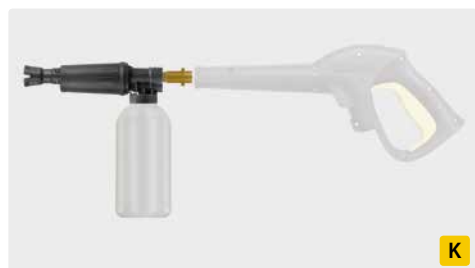
Bajonett K. Messing. Schauminjektorlanze mit Dosierung und Flasche. Max. 300 bar / 80 °C