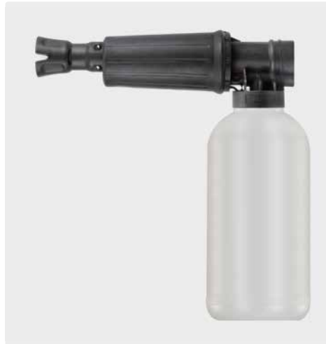
1/4" IG. Schauminjektorlanze mit Dosierung und Flasche. Max. 300 bar / 80 °C