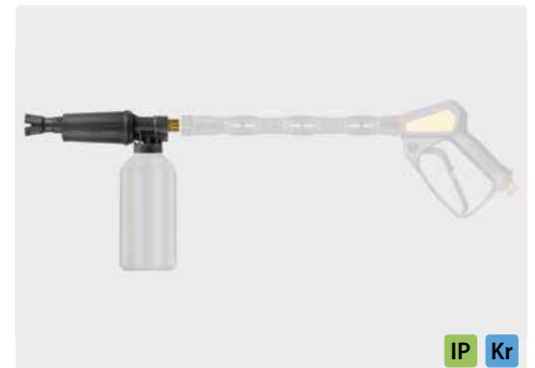
M22 AG. Schauminjektorlanze mit Dosierung und Flasche. Max. 300 bar / 80 °C