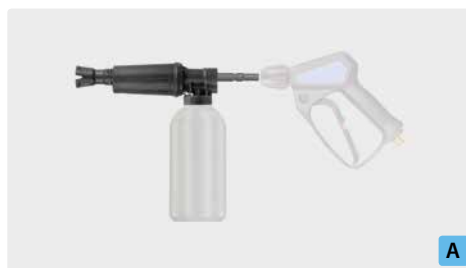
Stecknippel KW. Schauminjektorlanze mit Dosierung und Flasche. Max. 300 bar / 80 °C