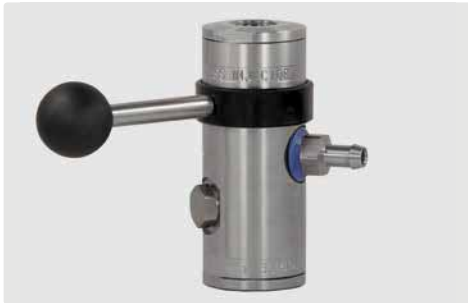
easyfoam365+ Bypass Injektor ST-167 mit Tülle 9 mm