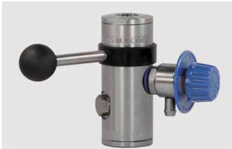
easyfoam365+ Bypass Injektor ST-167 mit Dosierventil ST-161 und Tülle 9 mm