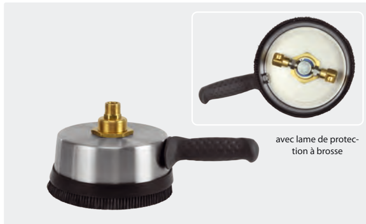
avec lame de protection à brosse