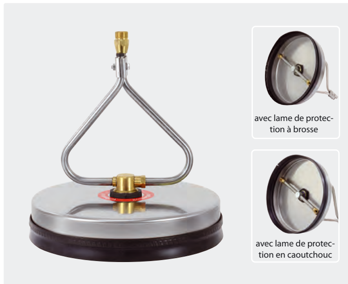
avec lame de protection à brosse