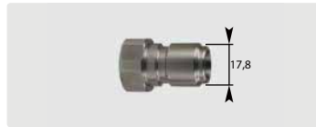
Stecknippel : IG. Edelstahl. Max. 250 bar / 150 °C