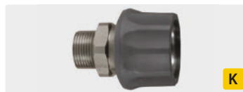
Kupplung : AG. Edelstahl. Max. 250 bar / 150 °C