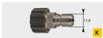
Stecknippel : IG. Edelstahl + Messing. Max. 250 bar / 150 °C