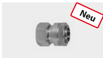
Kupplung : IG. Edelstahl. Max. 150 bar / 90 °C