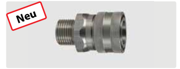
Kupplung : AG. Edelstahl. 60° Dichtkonus. Max. 250 bar / 150 °C