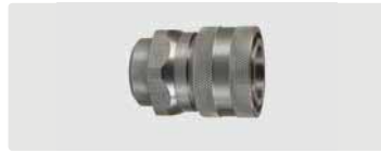
Kupplung : IG. Edelstahl. Max. 250 bar / 150 °C