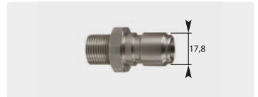
Stecknippel : AG. Edelstahl. 60° Dicht- konus. Max. 250 bar / 150 °C