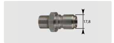
Stecknippel : AG. Edelstahl. 60° Dichtkonus. Max. 250 bar / 150 °C