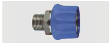
Kupplung : AG. Edelstahl. 60° Dichtkonus. Max. 250 bar / 150 °C