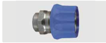
Kupplung : IG. Edelstahl. Max. 250 bar / 150 °C