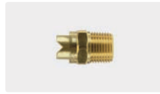
1/2" AG. Messing. Schaumdüse