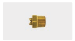
1/2" AG. Messing. Schaumdüse