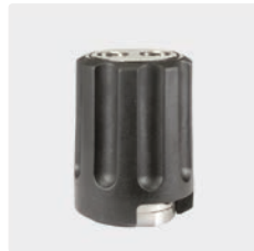
2 x 1/4" IG : 1/4" IG. ST-58 Umschaltventil. Max. 350 bar / 45 l/min