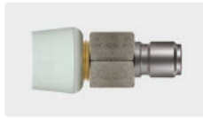
Nippel ST-3100 mit Schaumdüse 50° 200