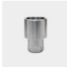
1/4" IG NPT : 3/8" IG. Edelstahl. Muffe