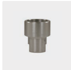
1/4" IG : 1/4" IG. Edelstahl. Muffe