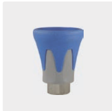
1/4" IG. Kunststoff. Edelstahl