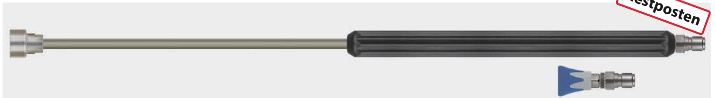
Stecknippel ST-3100. Lanze aus Edelstahl mit umspritzter Isolierung und Edelstahl Düsenmuffe ohne Düse