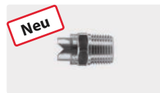
1/2" AG. Edelstahl. Schaumdüse