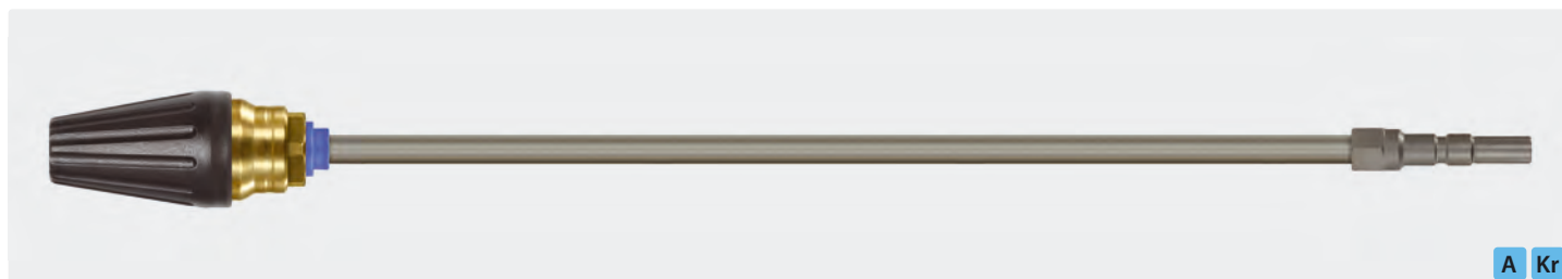
Coupleur KW. Lances tube zingué avec rotabuse ST-458.1. Cône 20°. 200 - 400 bar. Max. 100 °C