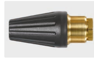
1/2" IG. Spritzwinkel 20°. 120 - 250 bar. Max. 100 °C