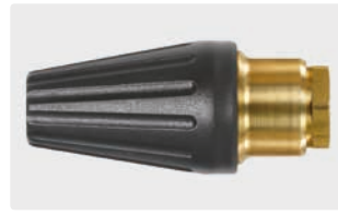
1/2" IG. Spritzwinkel 20°. 120 - 250 bar. Max. 100 °C