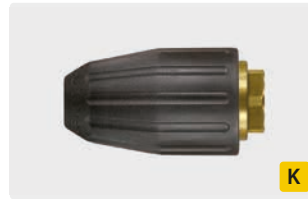
M18 IG. Spritzwinkel 20°. 200 - 350 bar. Max. 100 °C