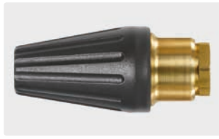
1/4" IG. Spritzwinkel 20°. 120 - 250 bar. Max. 100 °C