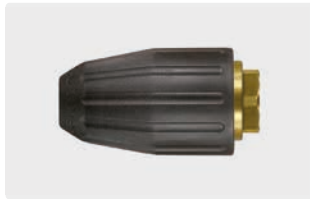
1/4" IG. Spritzwinkel 20°. 200 - 350 bar. Max. 100 °C