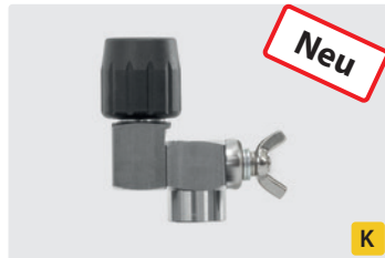
Edelstahl. Feststellbar. Max. 310 bar / 45 l/min / 150 °C