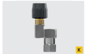
Edelstahl. Max. 310 bar / 45 l/min / 150 °C