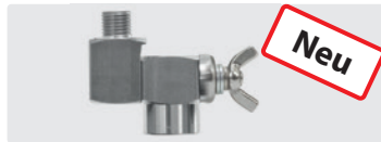
Edelstahl. Feststellbar. Max. 310 bar / 45 l/min / 150 °C