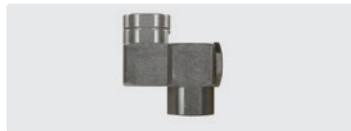
Edelstahl. Max. 310 bar / 45 l/min / 150 °C