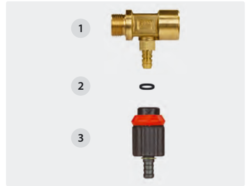
Min. 2 bar - max. 10 bar. Débit à 2 bar environ 150 l/h. Concentration réglable jusqu'à 11,5 %