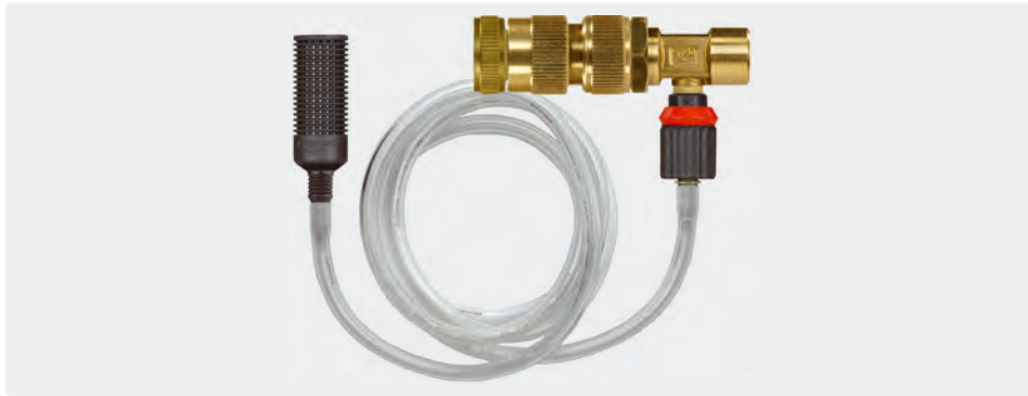
Injecteur avec dosage. Tuyau d'aspiration 1 m. Crépine ST-31. Min. 2 bar - max. 10 bar