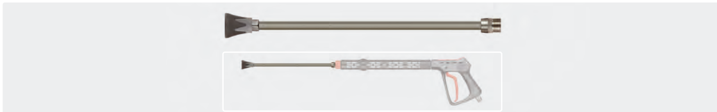
M22 M. Lance 335 mm avec porte-buse ST-10, livrée sans buse. Adaptée au pistolet équipé du manchon ST-9. Max. 500 bar / 150 °C