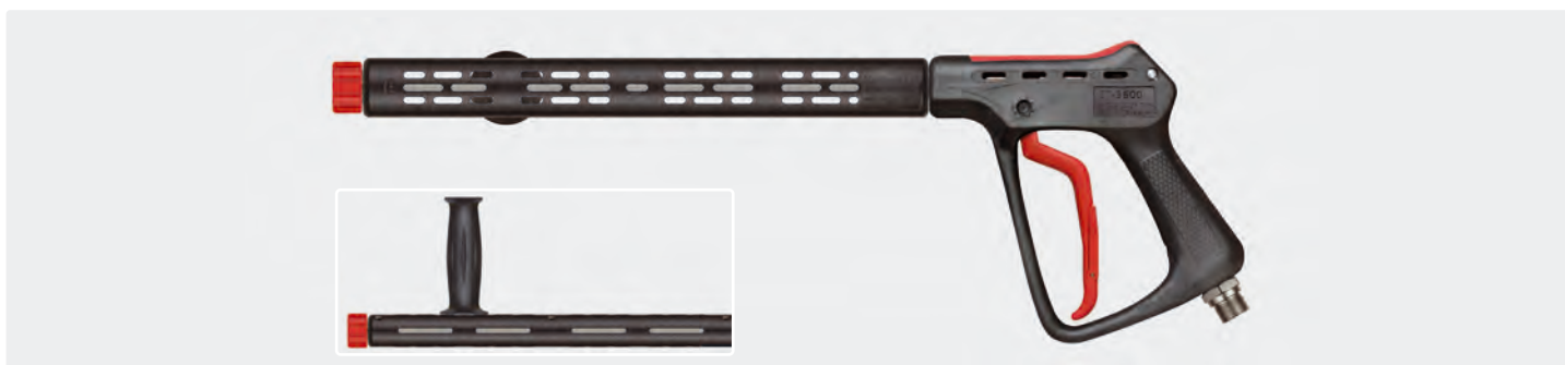
Pistolet THP professionnel avec demi-coquilles ST-9 380 mm, poignée latérale et raccord manuel M22 F. Max. 500 bar / 80 l/min / 150 °C