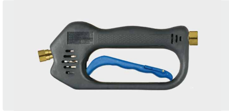
ST-601 Linear Frostschutz

Frostschutzausführung. Max. 275 bar / 45 l/min / 150 °C