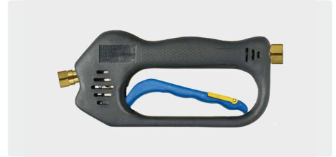
ST-601 Linear Weep

Weepausführung. Max. 275 bar / 45 l/min / 150 °C