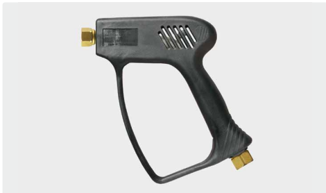
ST-1500 ohne Ventil (Freifluss)

Professionelle Pistole ohne Ventil (Freifluss). Max. 275 bar / 45 l/min / 150 °C