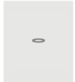
Aludichtscheiben für 1/4" IG. Ø 11 mm