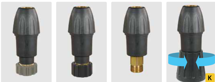
Kupplung KW : HV M22. Messing