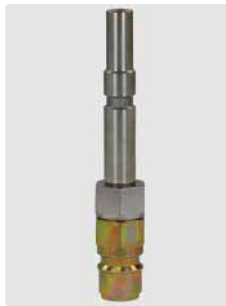
Stecknippel KW Edelstahl : Stecknippel ST-45 Stahl verzinkt