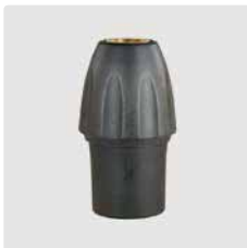
Kupplung KW : 1/4" AG. Messing