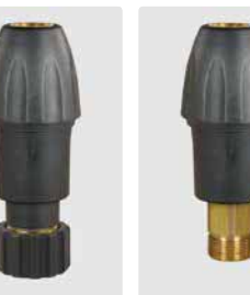
Kupplung KW : HV M22. Messing