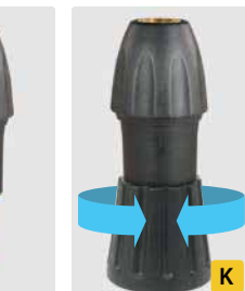
Kupplung KW : M22 AG. Messing