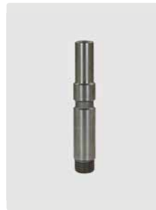
Stecknippel KW : 1/4" AG. Edelstahl