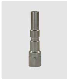
Stecknippel KW : 1/4" IG. Edelstahl. SW 19. Stecknippel für umspritzte Lanzen