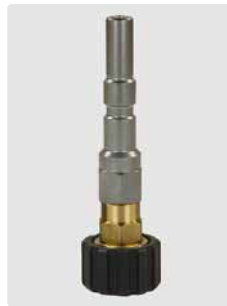
Stecknippel KW Edel- stahl : HV M22 Messing