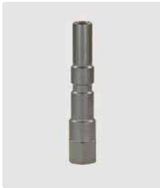
Stecknippel KW : 1/4" IG. Edelstahl. SW 17. Für Lanzen mit Halbschalen