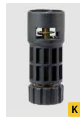
HV M22 kurz