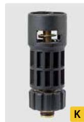
HV M22 lang