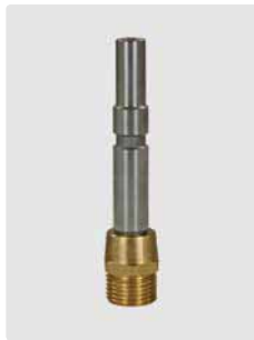
Stecknippel KW Edel- stahl : M22 AG Messing. Lanzen mit Quickver- schraubung