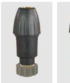
Kupplung KW : HV M21. Messing