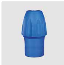
Kupplung KW : 1/4" AG. Edelstahl