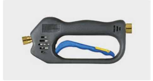
ST-601 Linear Weep

Weepausführung. Max. 275 bar / 45 l/min / 150 °C