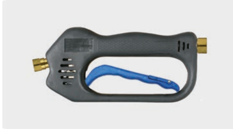
ST-601 Linear Frostschutz

Frostschutzausführung. Max. 275 bar / 45 l/min / 150 °C