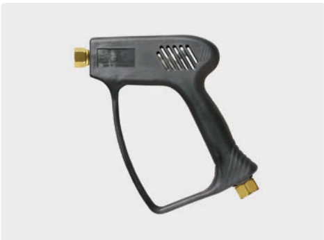
ST-1500 ohne Ventil (Freifluss)

Professionelle Pistole ohne Ventil (Freifluss). Max. 275 bar / 45 l/min / 150 °C