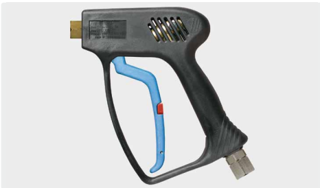
Professionelle Pistole. Frostschutzausführung. Max. 275 bar / 45 l/min / 150 °C