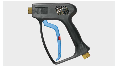
Professionelle Pistole. Frostschutzausführung. Max. 275 bar / 45 l/min / 150 °C