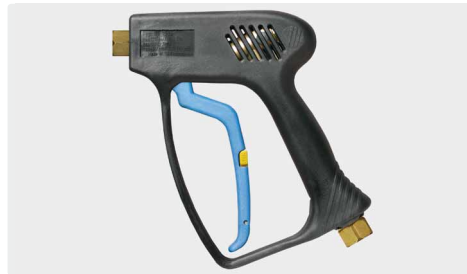
Professionelle Pistole. Weepausführung. Max. 275 bar / 45 l/min / 150 °C