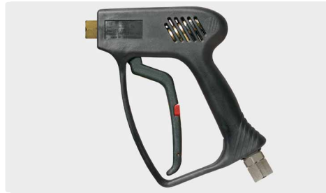
Professionelle Pistole. Max. 275 bar / 45 l/min / 150 °C