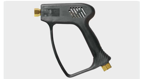
Professionelle Pistole ohne Ventil (Freifluss). Max. 275 bar / 45 l/min / 150 °C