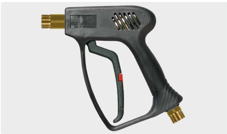
Professionelle Pistole. Max. 275 bar / 45 l/min / 150 °C