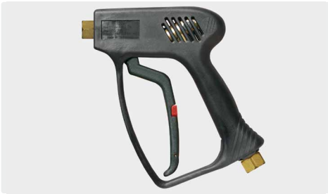
Professionelle Pistole. Max. 275 bar / 45 l/min / 150 °C