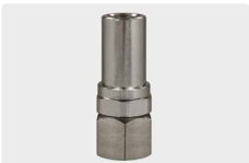
1/4" IG : 3/8" IG. ST-1500