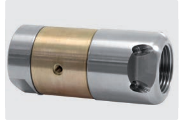
3/4" IG. 4 Bohrungen hinten. 3 Bohrungen seitlich. Außen \varnothing 38 mm. 554 g.