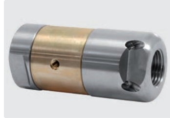
1/2" IG. 4 Bohrungen hinten. 3 Bohrungen seitlich. Außen \varnothing 38 mm. 585 g.