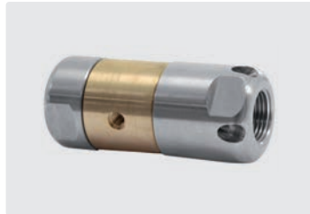
3/8" IG. 4 Bohrungen hinten. 3 Bohrungen seitlich. Außen \varnothing 30 mm. 305 g.