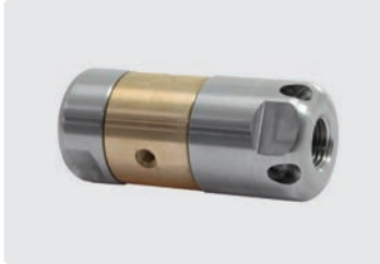
1/4" IG. 4 Bohrungen hinten. 3 Bohrungen seitlich. Außen \varnothing 30 mm. 317g.

durch mindestens 4 speziell angeordnete Rückstrahlen. Druck max. 350 bar.