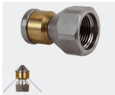
3/8" F. \varnothing 24 mm. Max. 250 bar