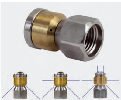
1/4" F. \varnothing 19 mm. Max. 250 bar