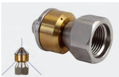
3/8" F. \varnothing 24 mm. Max. 250 bar