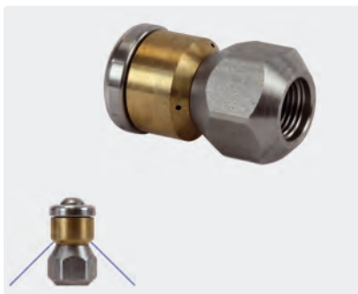
1/8" F. \varnothing 19 mm. Max. 250 bar