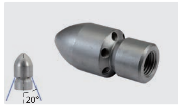
1/4" IG. Außen \varnothing 25 mm. Bohrungen hinten