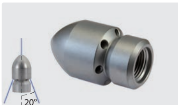
3/8" IG. Außen \varnothing 30 mm. Bohrungen hinten, 1 Bohrung vorn