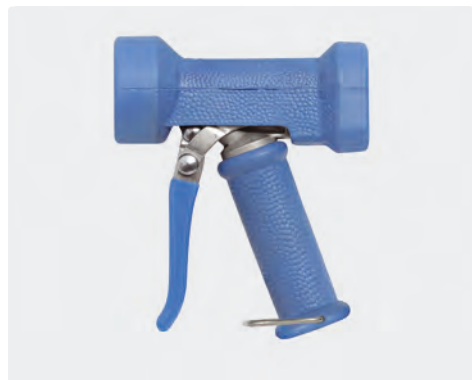
Pistolet avec jet à réglage progressif. Max. 24 bar / 100 l/min / 50 °C