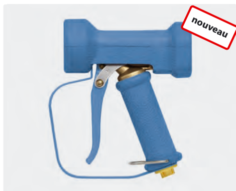
Pistolet avec jet à réglage progressif. Anse de sécurité. Max. 24 bar / 100 l/min / 50 °C