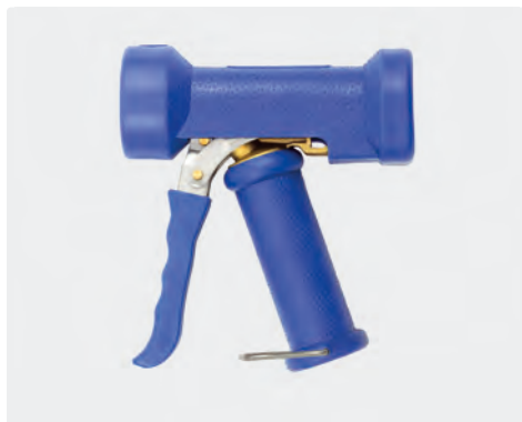
Pistolet avec jet à réglage progressif. Max. 24 bar / 100 l/min / 50 °C