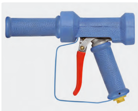
Pistolet avec jet à réglage progressif. Anse de sécurité. Max. 24 bar / 100 l/min / 95 °C