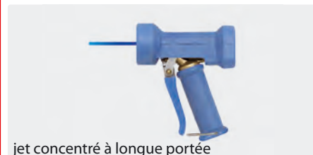
jet concentré à longue portée