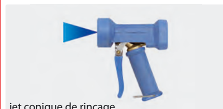
jet conique de rinçage

D'autres modèles de pistolets ST-1200 sont livrables sur demande !