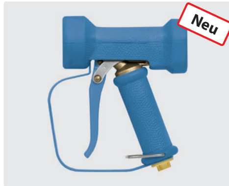
Pistole mit stufenloser Spritzwinkelveränderung. Sicherungsbügel. Max. 24 bar / 100 l/min / 50 °C