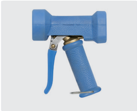
Pistole mit stufenloser Spritzwinkelveränderung. Max. 24 bar / 100 l/min / 50 °C