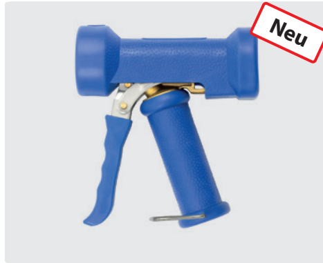
Pistole mit stufenloser Spritzwinkelveränderung. Max. 24 bar / 100 l/min / 50 °C