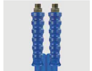
AGR : AGR