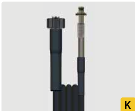
HV : Stecknippel mit Lager