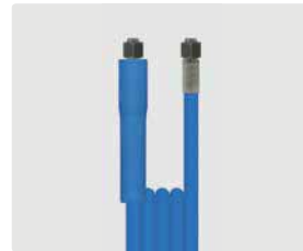
Dichtkegel (DKOL) VA