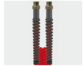
Male thread (AGR)