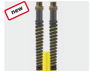
Male thread (AGR)