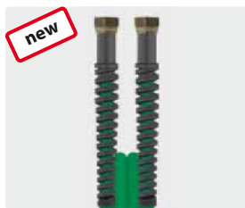
Female thread (DKR)