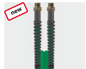
Male thread (AGR)