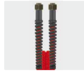
Female thread (DKOL)