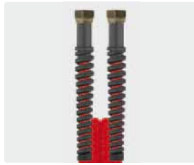
Female thread (DKR)