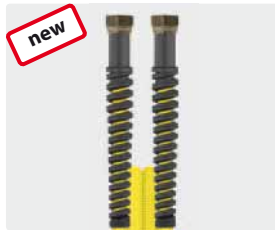
Female thread (DKR)