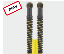
Female thread (DKOL)