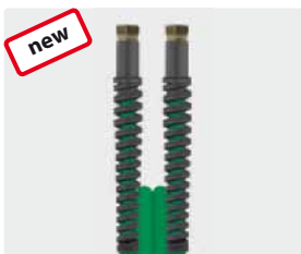
Female thread (DKR)