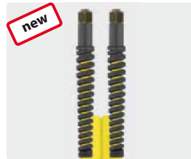
Female thread (DKOL)