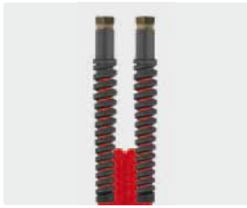
Female thread (DKR)