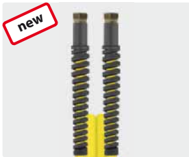
Female thread (DKR)