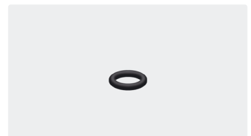
Joint torique. 13x2