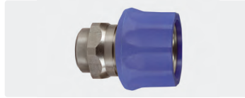
Coupleur surmoulé femelle : femelle. Inox. Max. 250 bar / 150 °C