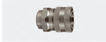
Coupleur femelle : femelle. Inox. Max. 250 bar / 150 °C