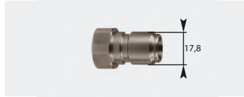
Coupleur mâle : femelle. Inox. Max. 250 bar / 150 °C