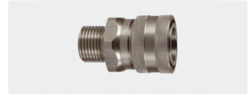
Coupleur femelle : mâle. Inox. Cône 60°. Max. 250 bar / 150 °C