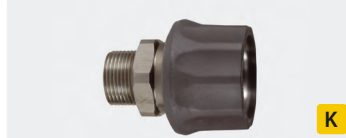
Coupleur surmoulé femelle : M22 M. Inox. Max. 250 bar / 150 °C