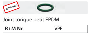
Joint torique petit EPDM