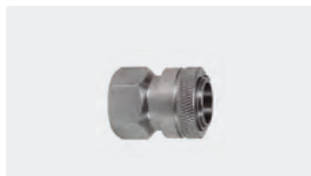
Coupleur femelle : femelle. Inox. Max. 150 bar / 90 °C