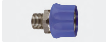
Coupleur surmoulé femelle : mâle. Inox. Cône 60°. Max. 250 bar / 150 °C