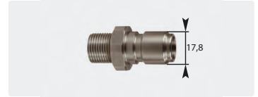
Coupleur mâle : mâle. Inox. Cône 60°. Max. 250 bar / 150 °C