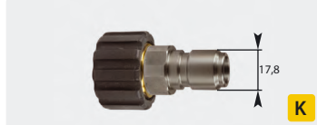
Coupleur mâle : M22 F. Inox + laiton. Max. 250 bar / 150 °C