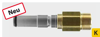
ST-247 : M22 AG. Edelstahl gehärtet. Max. 400 bar / 150° C