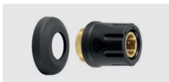
M22 IG. Messing. Inkl. 1 Hitzeschutz-Abdeckkappe. Max. 400 bar / 150° C