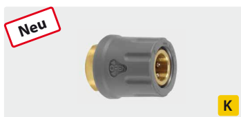
TR22 IG. Messing. Max. 400 bar / 150° C