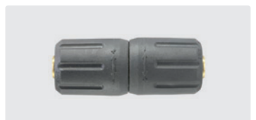
ST-247. Messing. Max. 310 bar / 45 l/min / 150° C