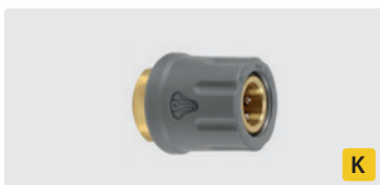
TR22 IG. Messing. Max. 400 bar / 150° C