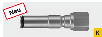
ST-247 : 1/4" IG. Edelstahl gehärtet. Max. 400 bar / 150° C