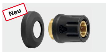
M22 IG. Messing. Inkl. 1 Hitzeschutz-Abdeckkappe. Max. 400 bar / 150° C