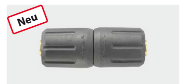
ST-247. Messing. Max. 310 bar / 45 l/min / 150° C