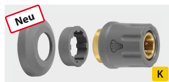
TR22 IG. Messing. Inkl. 2 Hitzeschutz-Abdeckkappen. Max. 400 bar / 150° C