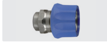
Kupplung : IG. Edelstahl. Max. 250 bar / 150 °C