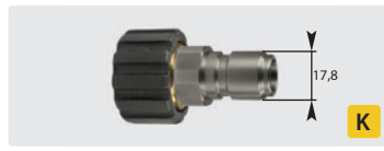
Stecknippel : IG. Edelstahl + Messing. Max. 250 bar / 150 °C