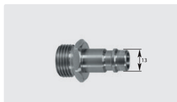
Stecknippel : AG. Edelstahl. Max. 150 bar / 90 °C