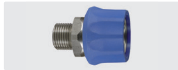
Kupplung : AG. Edelstahl. 60° Dicht- konus. Max. 250 bar / 150 °C