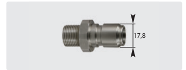
Stecknippel : AG. Edelstahl. 60° Dicht- konus. Max. 250 bar / 150 °C