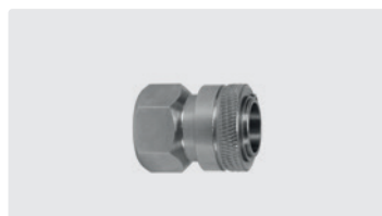
Kupplung : IG. Edelstahl. Max. 150 bar / 90 °C