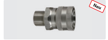
Kupplung : AG. Edelstahl. 60° Dicht- konus. Max. 250 bar / 150 °C