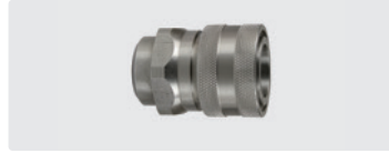
Kupplung : IG. Edelstahl. Max. 250 bar / 150 °C