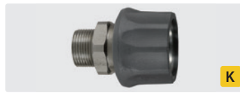
Kupplung : AG. Edelstahl. Max. 250 bar / 150 °C