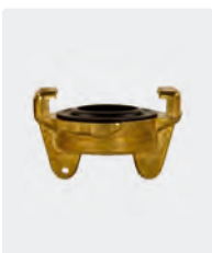
Bouchon baïonnette avec joint plat. Laiton