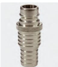
ST-45. Laiton cadmié. Embout avec cannelure 19-25 mm. 25 bar / 90° C