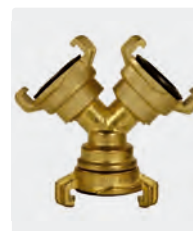
Distributeur "Y" avec coupleurs baïonnette. Laiton