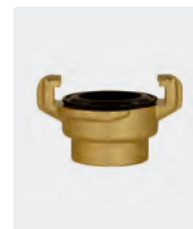
Femelle. Avec joint plat. Laiton