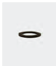
Joint plat. Raccords F