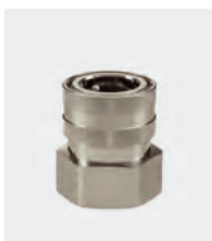
ST-45. Laiton cadmié. Coupleur : 1" F. 25 bar / 90° C