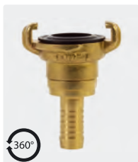
Droit rotatif. Laiton