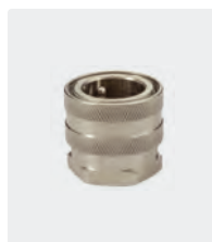
ST-45. Laiton cadmié. Coupleur : 3/4" F. 25 bar / 90° C