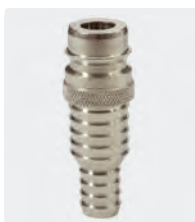
ST-45. Laiton cadmié. Embout avec cannelure 13-19 mm. 25 bar / 90° C