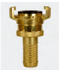
Pour aspiration *. Laiton