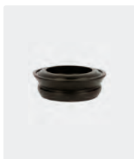
Joint à lèvres