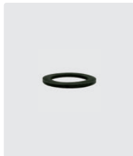
Flachdichtung. Für IG