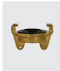
Blindkupplung mit Rippenring. Messing