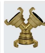
Y-Schlauchstück- kupplung. Messing