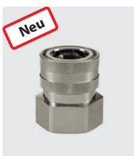
ST-45. Messing vernickelt. Kupplung : 1" IG. 25 bar / 90° C