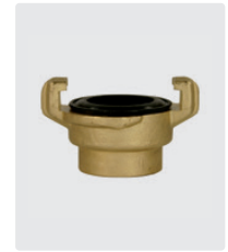
IG. Flachdichtung. Messing