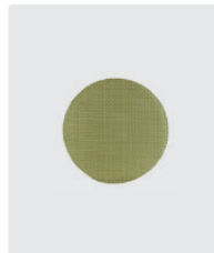
100 Maschen/cm². Messing. Siebein- satz. Ø 33 mm