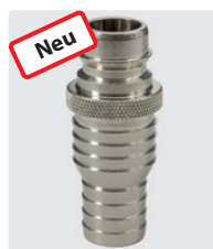
ST-45. Messing vernickelt. Stecknippel mit Schlauchtülle 19-25 mm. 25 bar / 90° C