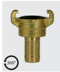
Gerade axial drehbar. Messing