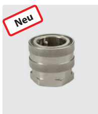
ST-45. Messing vernickelt. Kupplung : 3/4" IG. 25 bar / 90° C