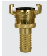
Saugkupplung *. Messing