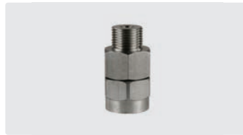
3/8" AG : 3/8" IG. Edelstahl. Max. 500 bar / 90 °C