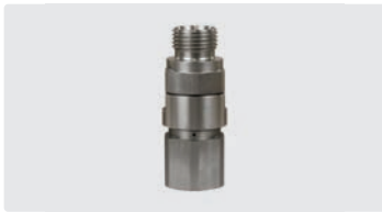
1/2" AG : 1/2" IG. Max. 600 bar