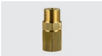
1/2" AG : 1/2" IG. Messing. Max. 250 bar / 90 °C