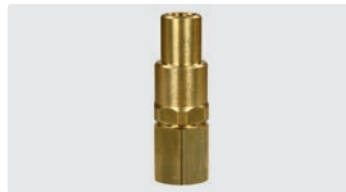
1/4" IG : 1/2" IG. Messing. Max. 250 bar / 90 °C