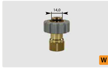
Standard M21: IG. Grau. Max. 400 bar / 150 °C