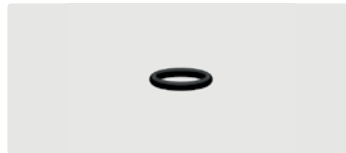
O-Ring. 10x2. Perbunan