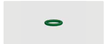
O-Ring. 10x2. Viton