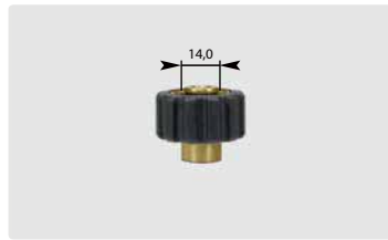
Kurz M22 : IG. Schwarz. Max. 400 bar / 150 °C