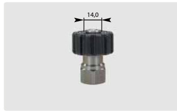
M22 : IG. Edelstahl. Max. 500 bar