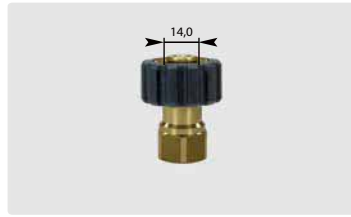
Standard M22 : IG. Schwarz. Max. 400 bar / 150 °C