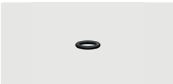
O-Ring. 10x2,2. Perbunan