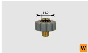
Kurz M21 : AG. Grau. Max. 400 bar / 150 °C