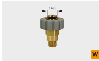
Standard M21 : AG. Grau. Max. 400 bar / 150 °C