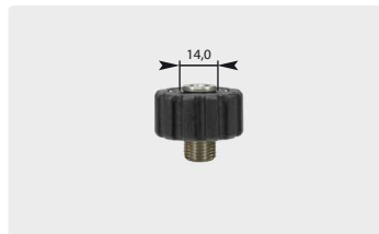
Kurz M22 : AG. Edelstahl. Max. 400 bar / 150 °C