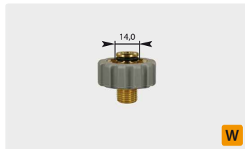
Kurz M21 : AG. Grau. Max. 400 bar / 150 °C