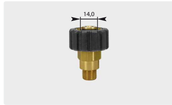
Standard M22 : AG. Schwarz. Max. 400 bar / 150 °C