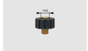
Kurz M22 : AG. Schwarz. Max. 400 bar / 150 °C