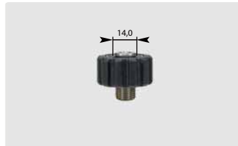
Kurz M22 : AG. Edelstahl. Max. 400 bar / 150 °C