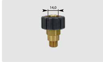
Standard M22 : AG. Schwarz. Max. 400 bar / 150 °C