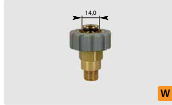
Standard M21 : AG. Grau. Max. 400 bar / 150 °C