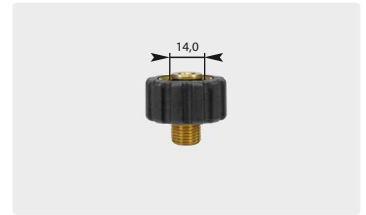
Kurz M22 : AG. Schwarz. Max. 400 bar / 150 °C