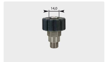
M22 : AG. Edelstahl. Max. 500 bar