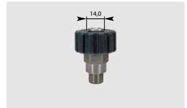
M22 : AG. Edelstahl. Max. 500 bar