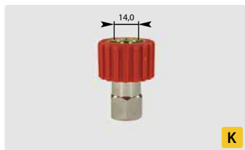
HV M22 : IG. Max. 250 bar / 120 °C