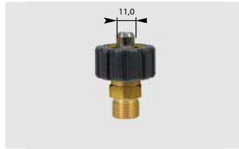
HV 1/2" : AG. Max. 300 bar / 150 °C