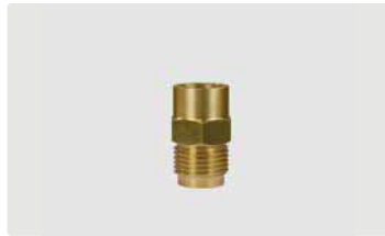
IG : 1/2" AG. Max. 300 bar / 150 °C