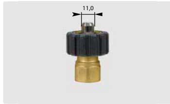
HV 1/2" : IG. Max. 300 bar / 150 °C