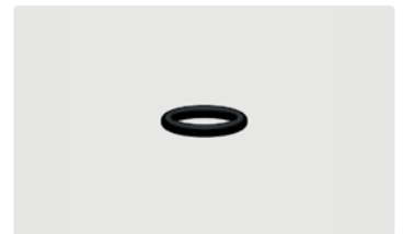
O-Ring Swivel MSM