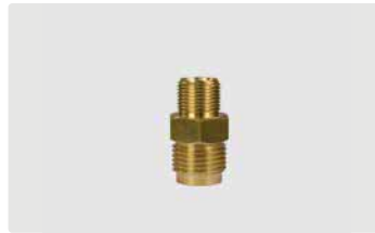
AG : 1/2" AG. Max. 300 bar / 150 °C