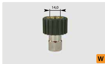
HV M21 : IG. Max. 250 bar / 120 °C