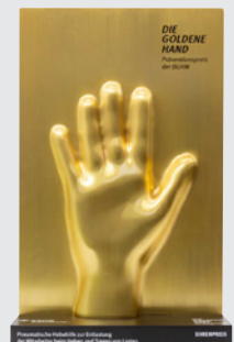
Präventionspreis der BGHW