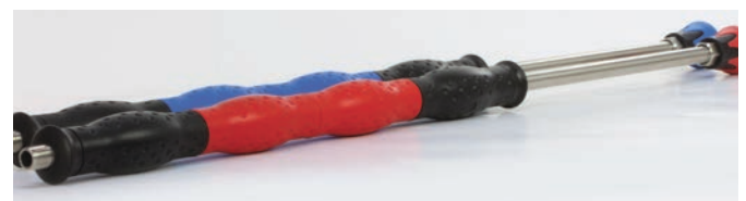
Formschön: Farbgebung für unterschiedliche Einsatzgebiete.