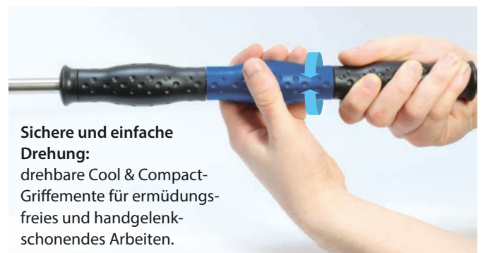
Sichere und einfache Drehung: drehbare Cool & Compact-Griffelemente für ermüdungsfreies und handgelenkschonendes Arbeiten.

Düzenschutz ST-10 optional: viele verschiedene Farben finden Sie im Katalog auf Seite 259.