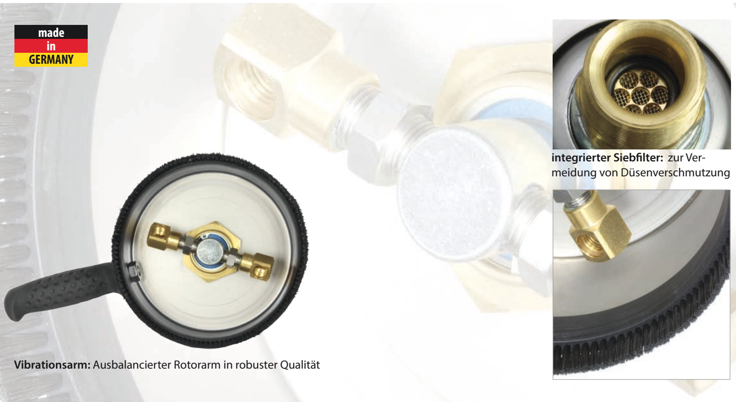
integrierter Siebfilter: zur Vermeidung von Düsenverschmutzung