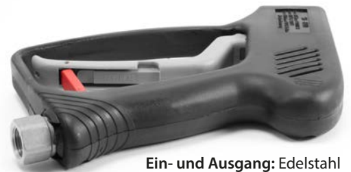
Ein- und Ausgang: Edelstahl

Innere Werte: Hochwertige Materialien für beste Chemiebeständigkeit. R+M Nr. 202 000 054 auch für ST-2000 und ST-601 einsetzbar.